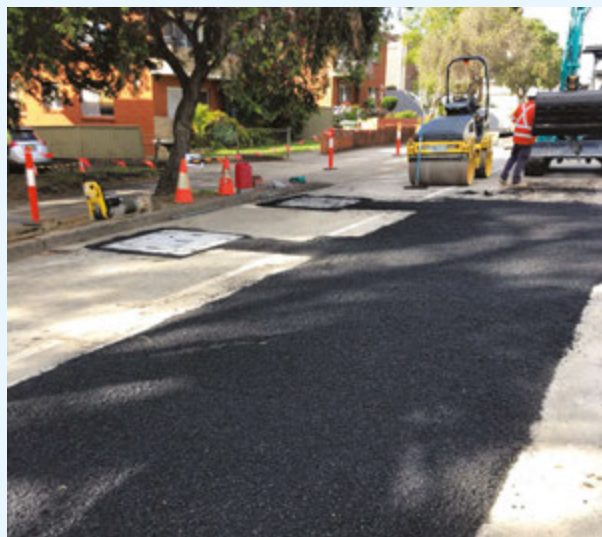
Restauro stradale temporaneo, Yangoora Road, Lakemba