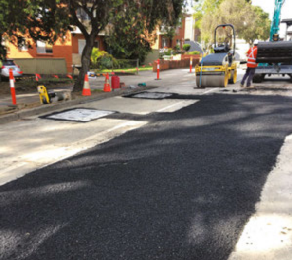
ترميم الطرق بشكل مؤقت، Yangoora Road, Lakemba