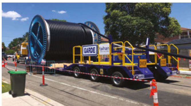
توصيل وسحب الكابلات إلى القنوات في Maiden Street, Greenacre

نحن حريصون على العمل معكم للحد من الآثار الناجمة عن المشروع. ساعدتنا التعليقات التي تلقيناها حتى الآن على تحسين الطريقة التي نقوم بها بعملنا ضمن المجتمع. ونتوجه بالشكر لكل من تواصل معنا حتى الآن.