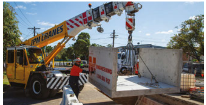
Xây dựng hầm kết nối tại Hillcrest Avenue, Greenacre