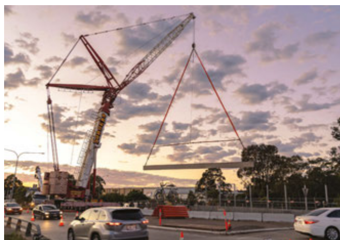
I lavori sul ponte strallato della Muir Road durante il "long weekend" di ottobre.