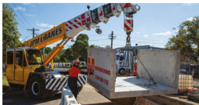
Costruzione di un pozzetto per cavidotti a Hillcrest Avenue, Greenacre