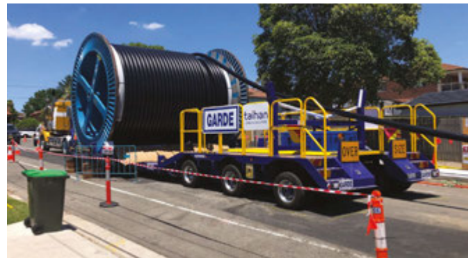
Τροφοδοσία και έλξη καλωδίου στους αγωγούς στην Maiden Street, Greenacre

Μέλημά μας είναι να συνεργαστούμε μαζί σας ώστε να ελαχιστοποιήσουμε τις επιδράσεις του έργου. Τα σχόλια που έχουμε λάβει μέχρι στιγμής μας βοήθησαν να βελτιώσουμε τον τρόπο που εργαζόμαστε στην κοινότητα. Θα θέλαμε να ευχαριστήσουμε όλους όσοι επικοινωνήσαν μαζί μας μέχρι τώρα.